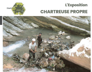
L'Exposition CHARTREUSE PROPRE

Cela sera aussi l'occasion d'échanger avec vous.